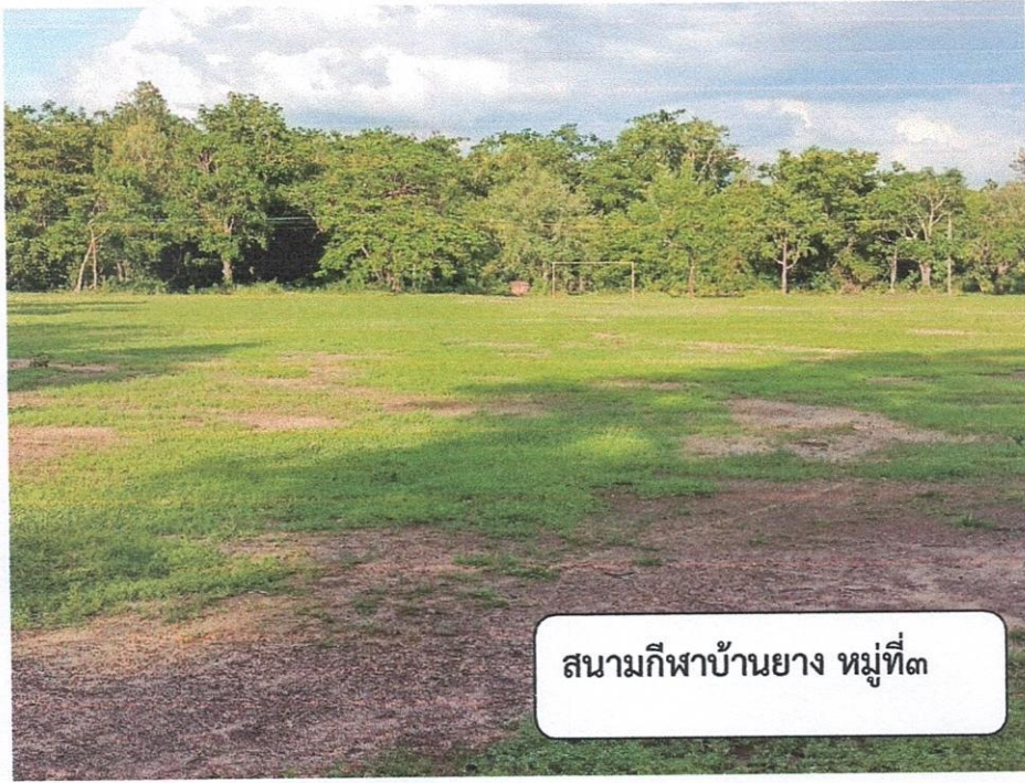
หมู่ ๓ บ้านยาง