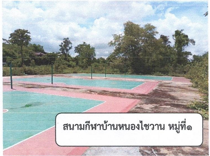
สนามกีฬาบ้านหนองไขววน หมู่ที่ ๑