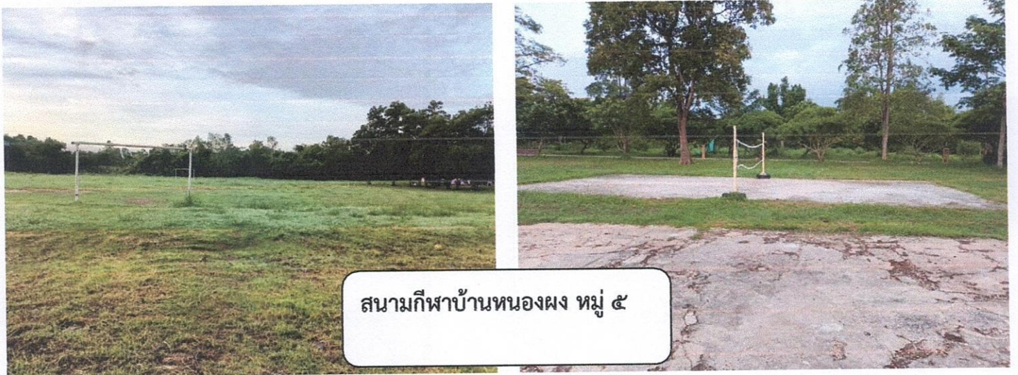
หมู่ ๕ บ้านหนองผง