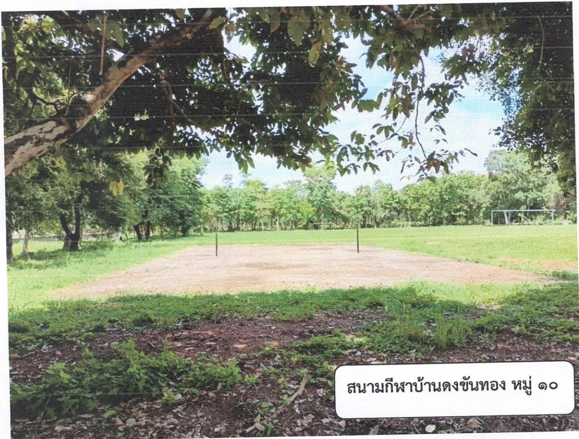
สนามกีฬاب้านดงขันทอง หมู่ ๑๐