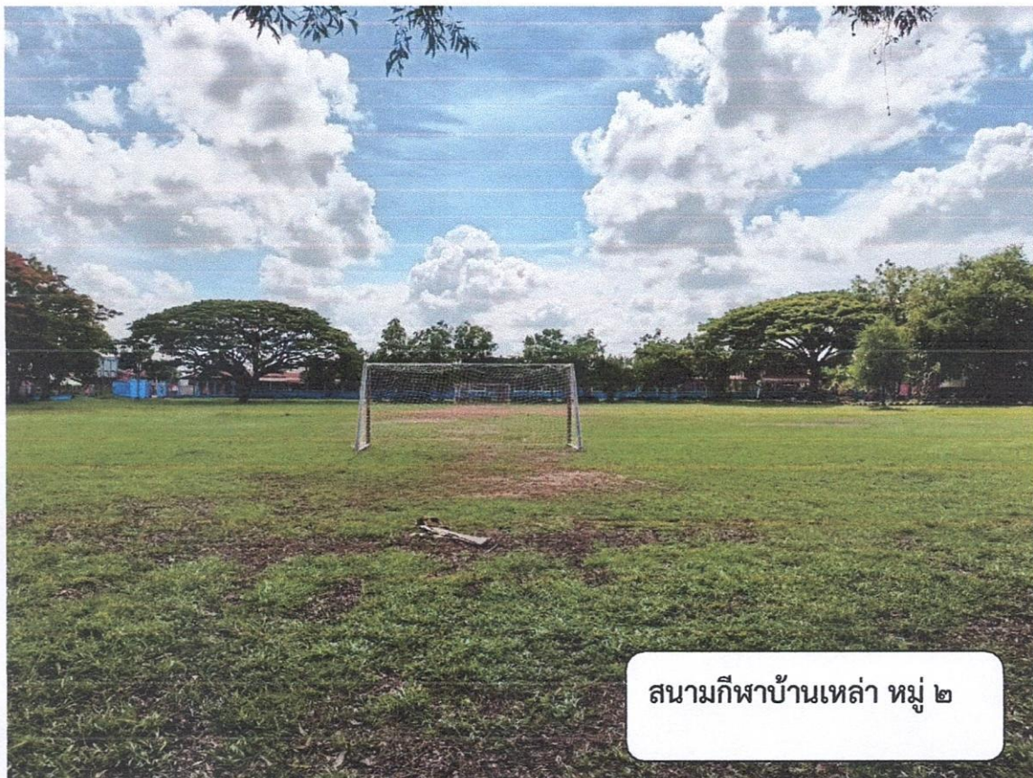
สนามกีฬาบ้านเหล่า หมู่ ๒