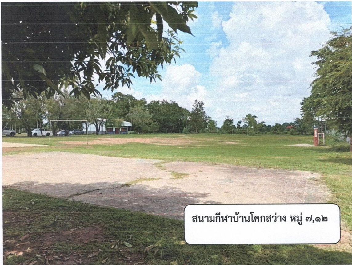
สนามกีฬที่บ้านโคกสว่าง หมู่ ๗,๑๒