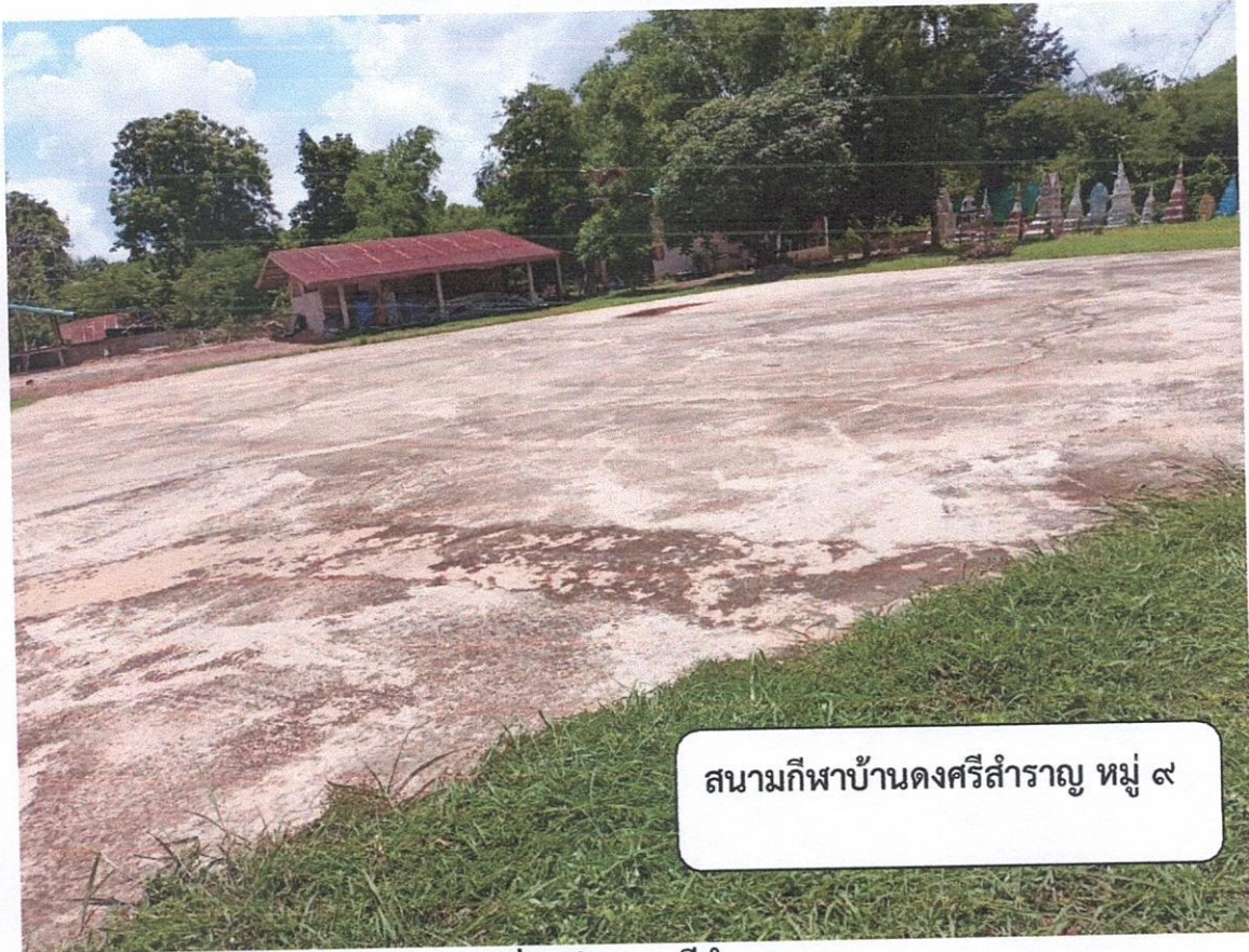
สนามกีฬاب้านดงศรีสำราญ หมู่ ๙